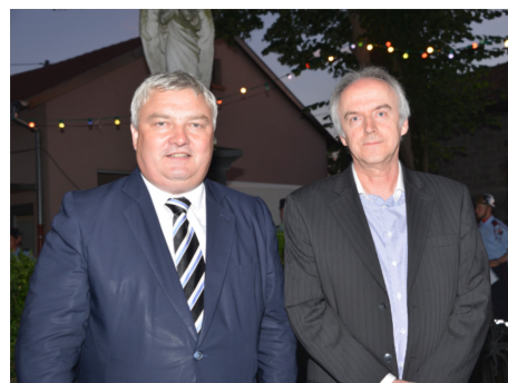
Diplômes remis par le Député Eric STRAUMANN