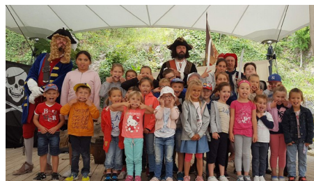
Sortie au château du Hohlandsbourg

C 'est avec beaucoup d'énergie et d'enthousiasme qu'ils leur ont proposé une multitude d'activités et de sorties. Le centre a rencontré un franc succès cette année avec pas moins de 120 enfants accueillis sur toute la période.