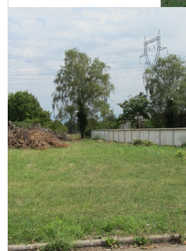
Coupe d'arbres au cimetière