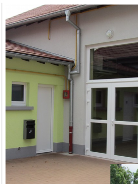
Peinture de la cour attenante à la salle des fêtes