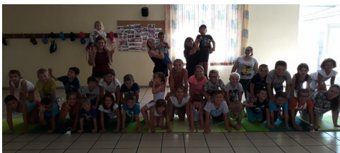
Journée cirque avec l'école de cirque de Ribeauvillé

C'est à travers des programmes très ludiques qu'ils ont pu vivre avec enthousiasme ces 4 semaines sur des thèmes bien différents (Japon, sports, nature et la plage). Le centre a à nouveau rencontré un franc succès cette année avec pas moins de 120 enfants accueillis sur toute la période.